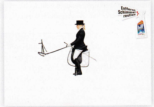
Platz 3 „Schimmelentferner“, wörtlich genommen von Tillmanns, Ogilvy & Mather, Düsseldorf, für Biff.