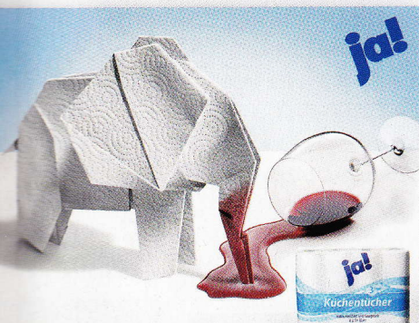
Platz 1 „Elefant“ heißt das Motiv von Counterpart, Köln, für Küchentücher der Handelsmarke ja! (Rewe).

wurden jetzt prämiert. Platz 1 (links) erhält Medialeistungen in Höhe von 750.000 Euro. Der Gewinner des Ambient Media Sonderpreises Famous Award, erstmals ausgeschrieben zusammen mit dem Fachverband Ambient Media (FAM), bekommt eine Million Werbeträger in Form von Freecards und gebrandeten Tischen in der Gastronomie. Mehr als 50 Anwärter bewarben sich um den neuen Sonderpreis. sh