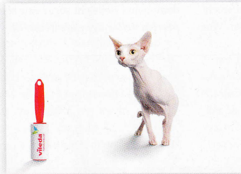
Platz 2 Die „Nacktkatze“ hatte offenbar Kontakt mit dem Vileda Fusselroller. Agentur: Viertakt, Erfurt.